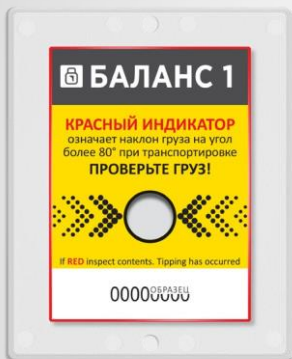
Индикатор в состоянии готовности