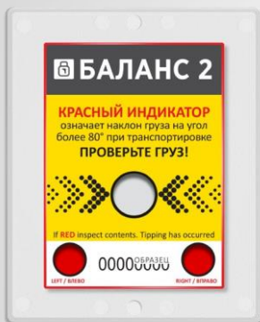
Индикатор в состоянии готовности