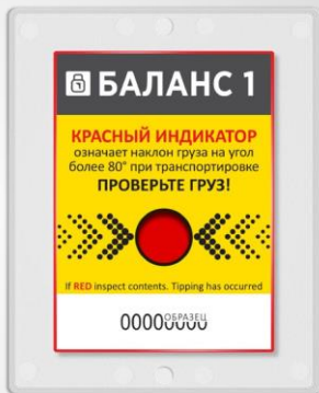
Индикатор в сработавшем состоянии при наклоне на \angle \geq 80^\circ в любую сторону